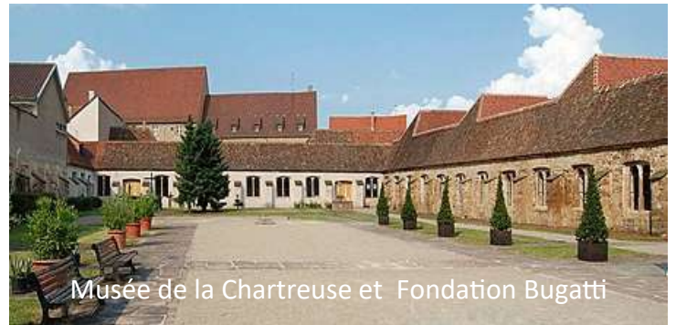
Musée de la Chartreuse et Fondation Bugatti